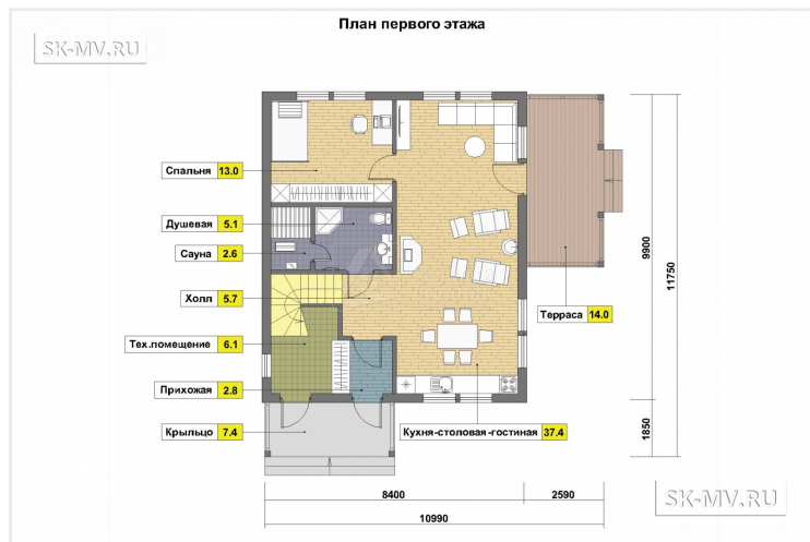
ПЛАН ПЕРВОГО ЭТАЖА. Вариант 2 С террасой без кровли