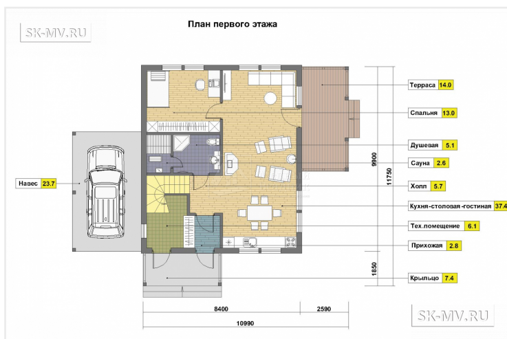
ПЛАН ПЕРВОГО ЭТАЖА. Вариант 1 С террасой под кровлей и навесом для автомобиля